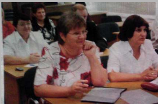
Павел КМСШОН, натльных Бещмево пттамта Тверского филиала Ёкты

гаж знаний, который сильно пригодится В дальнейшей работе. Хочется особо отметить высокий уровень преподавательского состава, обучение проходило в постоянном диалоге.